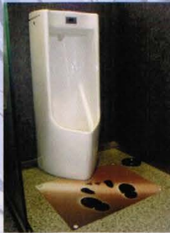
印有圖案的墊子 兼具功能和娛樂