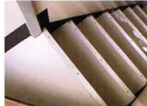
使用於階梯防止打滑