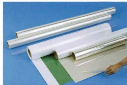
改變膜類產品常識的創新產品。 尺寸 W1350mm x 30m/W675mm x 30m 厚度 50um and 100um

薄膜不僅強度佳，美觀，還附加了特殊的性能。基本結構為，在 PET 基材表面鍍上一層特殊高硬化耐久抗藥防火塗層，背面則為一般離型膜。可廣泛應用於地板和牆壁、生活用品等各方面。這種突破性的超耐久膜，使用方式簡單，只需撕去背面的離型膜，即可黏貼。請發揮您的創意，讓此產品解決您所有的煩惱。