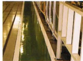
線段膠帶—工廠使用情形