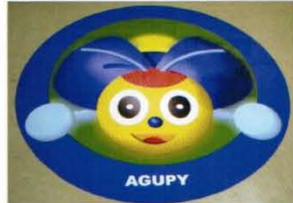
日本阿比久町之建築設施內