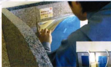
重視安全及清潔— 日本澡堂使用情況