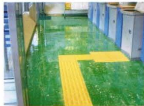
自動提款機之地板部份